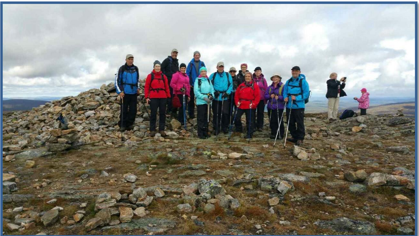
Ruskaretkeläisiä Kiilopään huipulla 2016