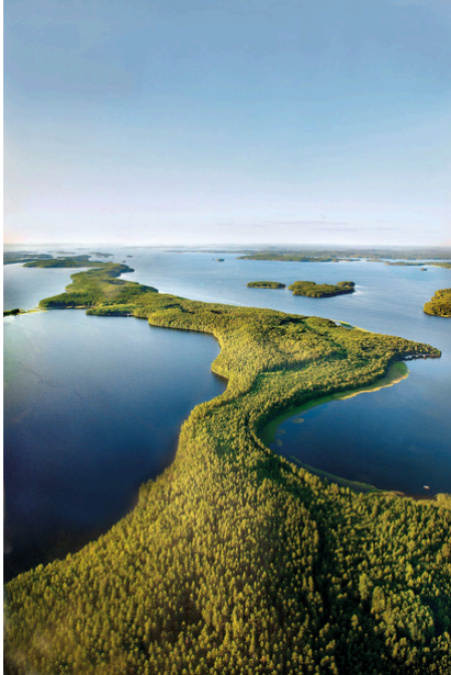
Kuva Kelventeen saaresta